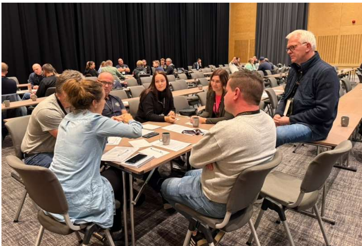
Gruppearbeid på NMK sitt Sportsmøte i oktober.